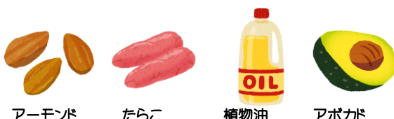
アーモンド たらこ 植物油 (ひまわり油・紅花油) アボカド