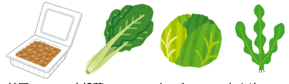
納豆 小松菜 キャベツ わかめ

出典・参考文献：少年写真新聞社 「たよになるね！食育ブック④基本の栄養素編」 日本図書センター 「たべることがめっちゃくちゃ楽しくなる！栄養素キャラクター図鑑」