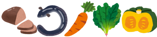
レバー(豚・鶏) うなぎ にんじん ほうれん草 かぼちゃ