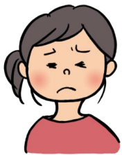
しょぼしょぼする