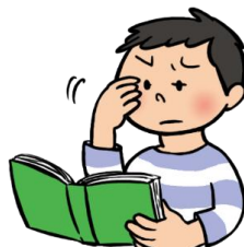
字がかすんで見える