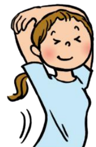
ストレッチをする

今の時代、携帯やPC、タブレット、テレビなどのメディアが生活の中で欠かせないものとなってきています。すぐに情報を入手できたり、人と会わなくてもコミュニケーションがとれたり便利な面がたくさんあります。一方で、身体への負担もあります。特に目は影響を受けやすく、知らず知らずのうちに疲れ目や視力低下の原因となってしまいます。メディアを使用するときは、「 姿勢を正す 」、「 目から30cm以上離して使用する 」、「 明るい場所で使用する 」、「 時間を決めて使用する 」等の工夫が必要です。疲れ目の症状を感じたら、目を休めてください。目を休めても、上のような症状が長期に渡って続く場合は他の原因も考えられますので、眼科に相談することをおすすめします！！