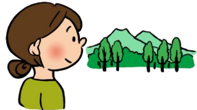
遠くを見て、目を休める